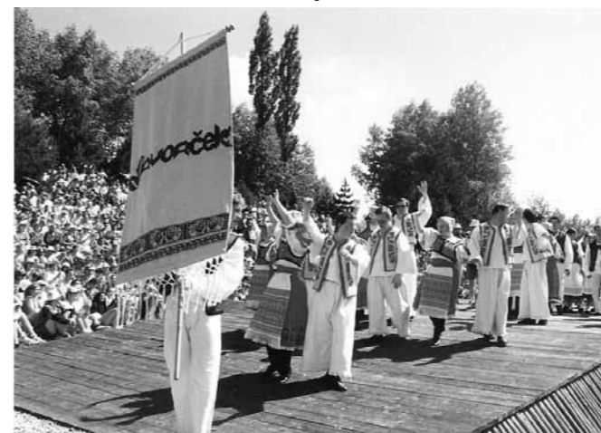
Vystúpenie FS Javorček na jubilejnom 40. ročníku Folklórneho festivalu Východná

Športové aktivity sú neoddeliteľnou súčasťou činnosti v Domove sociálnych služieb pre deti a dospelých (DSS). Pracovníci DSS (predtým ÚSS) vytvorili ideálne podmienky pre vznik organizácií, ktoré významnou mierou prispievajú k skvalitneniu starostlivosti o ľudí s mentálnym postihnutím v rámci celého Slovenska i v súčasnosti. Boli iniciátormi založenia Telovýchovnej jednoty Humanitas (1989 – 1999), Česko-Slovenského hnutia špeciálnych olympiád (1990), Slovenského zväzu športovcov