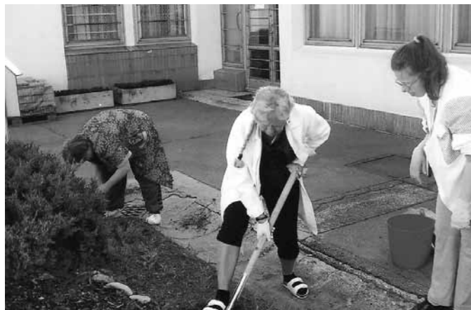
Práca v „Čarovnej záhrade“ a skleník