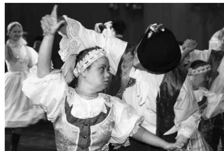
Vystúpenie FS Javorček a DFS Javorčatá v rámci integrovaného programu „Nám stačí aj pohľadanie“ pri príležitosti 40. výročia vzniku DSS pre deti a dospelých, Javorinská 7/a, Bratislava

Obohatením kultúrnych aktivít DSS sú nepochybne spoločenské tance. Práve tu sa zúročila úroveň pohybovej kultúry získaná tvrdým tréningom vo Folklórnom súbore Javorček.