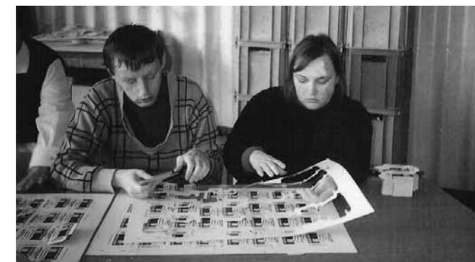
Kartonážne práce na ukladanie spiniiek do zošívacích strojčekov

Pracovná činnosť klientov patrila a patrí medzi hlavné priority v tomto zariadení. Zapojení boli do nej všetci, aj tí s najťažším postihnutím. V rokoch 1982 – 1993 pracovali v bratislavských podnikoch Cosmos, n.p., Záres, š.p.(Florea, a.s.) a Figaro, š.p. pod vedením majstrov pre pracovnú činnosť 36 klientov. Denne pracovali 4 hodiny a vykonávali jednoduché manuálne práce – skladali škatule a ukladali do nich zubné kefky, ošetrovali kvetiny v skleníkovom hospodárstve a triedili sušené hrozienka do čokolád. Do zamestnania boli dopravovaní ústavným autobusom. Pre ostatných bola v rokoch 1979 – 2007 zabezpečená primeraná práca v ÚSS (resp. DSS) pre KABLO, š.p., ZMDŽ, n.p., CHZJD, š.p. (Istrochem, a.s.) Tesla, k.p., NSP Ružinov, ITP (KLIMON),