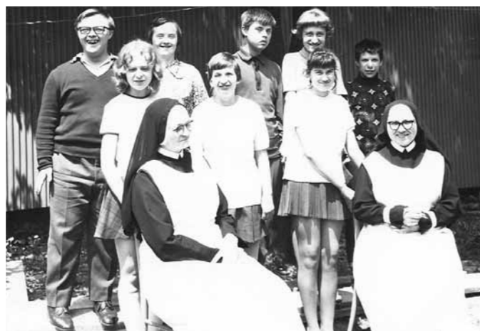
Prvé výchovné skupiny