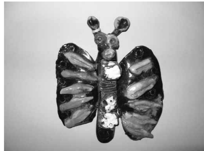
Ukážky prác z hlíny a glazovanej keramiky