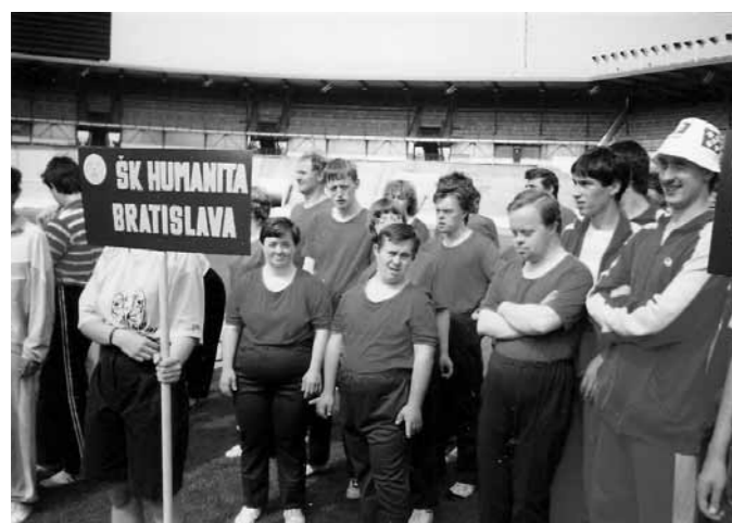
Športovci ŠK Humanitas pri DSS Javorinská 7/a, Bratislava na I. Česko-Slovenských letných špeciálnych olympijských hrách (1991)