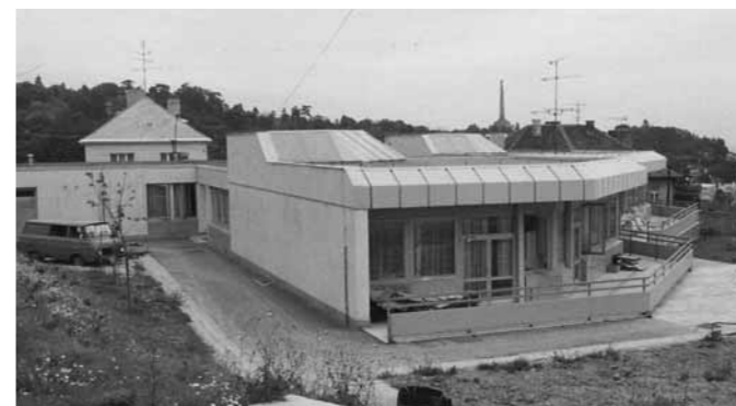
Budova ÚSS (DSS) Javorinská 7/a, Bratislava